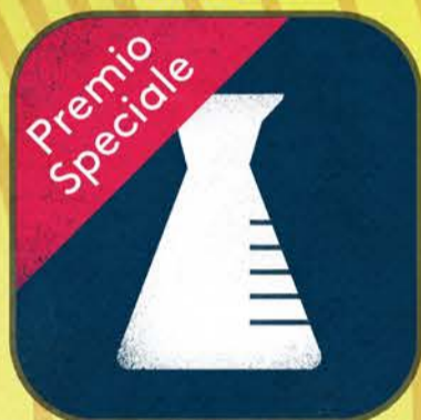
Chimica di base *