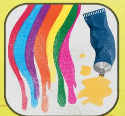
Vernici Inchiostri Adesivi