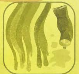
Vernici Inchiostri Adesivi