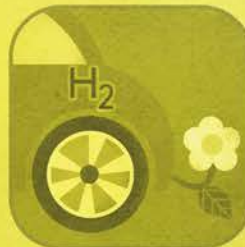
Auto a Idrogeno