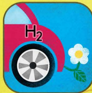
Auto a Idrogeno