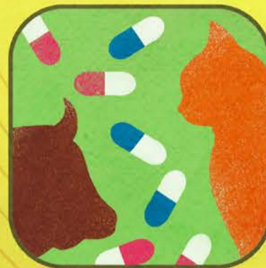
Farmaci per Animali