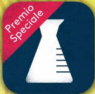
Chimica di base