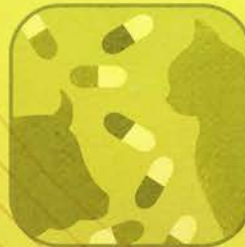
Farmaci per Animali