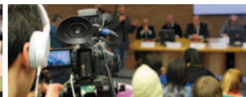
LA PAROLA ALLE SCUOLE