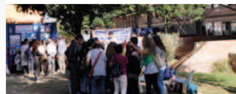
PIC NIC DELLA SCIENZA E DELLA TECNOLOGIA