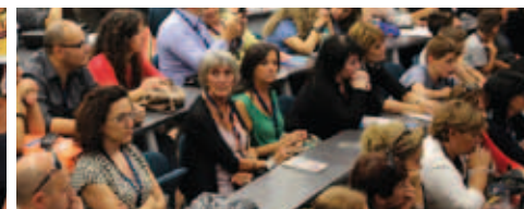
CONFERENZE, CONVEGNI, SEMINARI E WORKSHOP