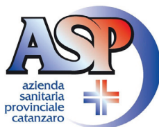
azienda sanitaria provinciale catanzaro