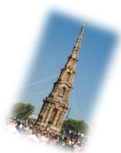
Obelisco di paglia