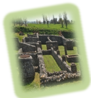
Parco Archeologico Aeclanum