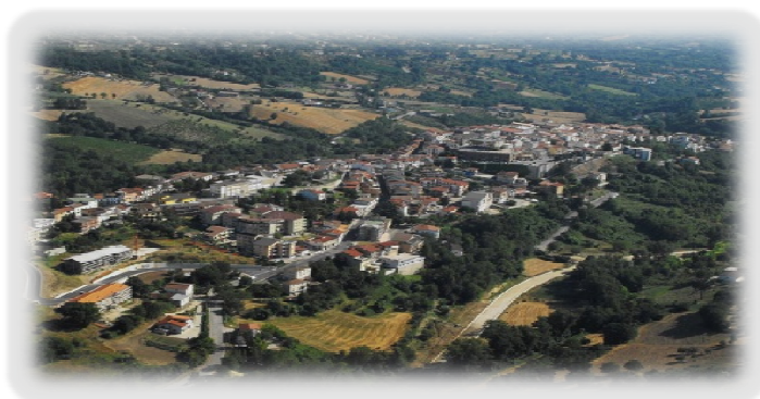
CITTÀ DI MIRABELLA ECLANO