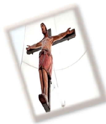
Cattedrale Santa Maria Maggiore Crocifisso Normanno (Sec. XII)