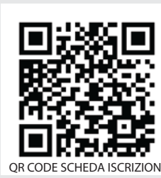
QR CODE SCHEDA ISCRIZIONE

Associazione Musicale "RAIMONDRUMS ORCHESTRAL"