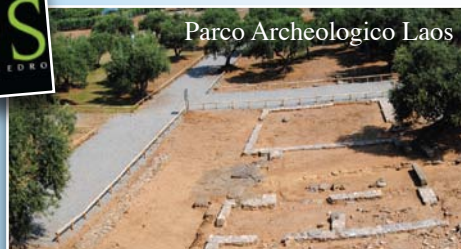
Parco Archeologico Laos