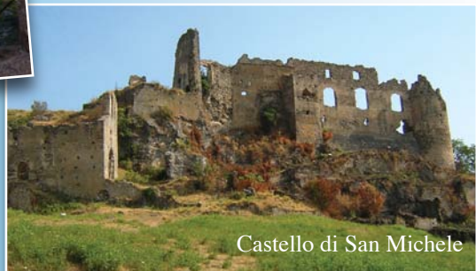
Castello di San Michele