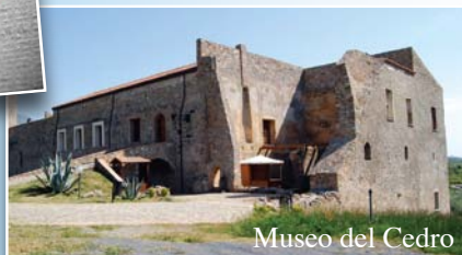
Museo del Cedro