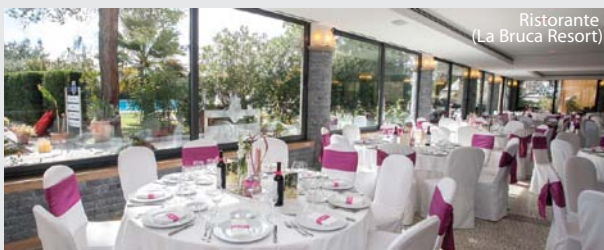
Ristorante (La Bruca Resort)