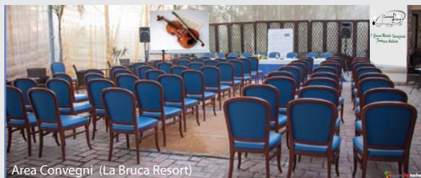
Area Convegni (La Bruca Resort)