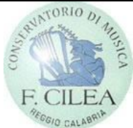
Conservatorio Francesco Cilea