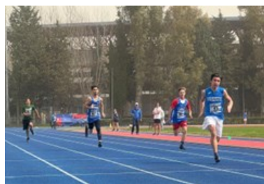
Atletica Leggera Cadetti/e – Allievi/e