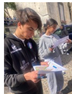
Orienteering Cadetti/e - Allievi/e