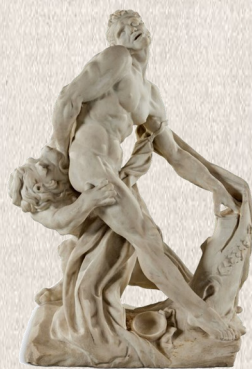
Milone di Pierre Puget Museo del Louvre, Parigi