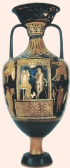
Anfora apula IV secolo a.C. dalla tomba del guerriero di Cariati Museo Archeologico Nazionale di Sibari

L'Educazione Motoria Fisica e Sportiva con le sue potenzialità formative e la sua capacità di suscitare interesse e impegno, è oggi riconosciuta come uno degli elementi essenziali e più validi di educazione permanente nel sistema globale dell'educazione e costituisce un aspetto irrinunciabile nel curriculum formativo disciplinare e nei processi di crescita, maturazione e sviluppo dello studente.