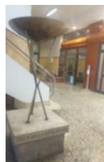
Braciere Olimpico 1960