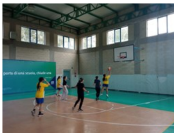
Pallacanestro 3x3 Cadetti/e – Allievi/e