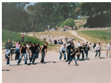
Studenti in visita all'antico stadio di Olimpia