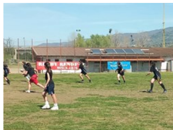
Tag Rugby Cadetti/e