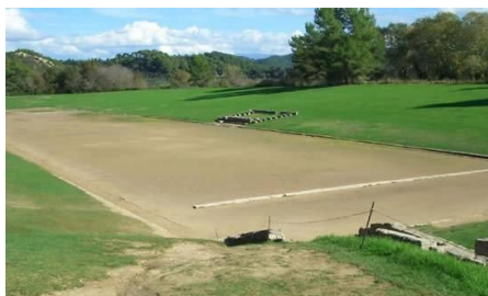
Vista dell'antico stadio di Olimpia

"E' importante non disattendere la cura del corpo e trovare una misura nel bere, nel mangiare e nell'esercizio.