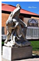
Statua di Milone