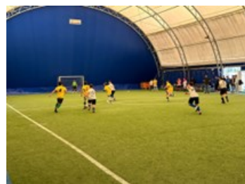
Calcio a 5 Cadetti/e – Allievi/e