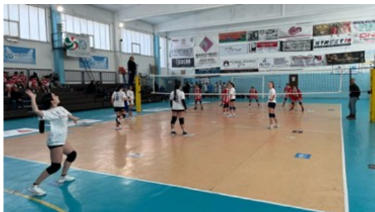
Pallavolo Cadetti/e – Allievi/e