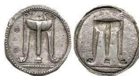
Kroton 50 vittorie 12 Atleti