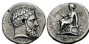
Lokoi Epizephiroi 7 vittorie 5 Atleti