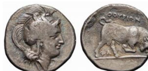
Thurii 4 vittorie 3 Atleti