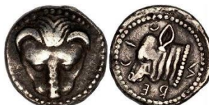
Rhegion 1 vittoria 1 Atleta