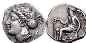
Therina 1 vittoria 1 Atleta