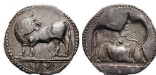
Sybaris 2 vittorie 2 Atleti