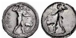
Kaulonia 1 vittoria 1 Atleta